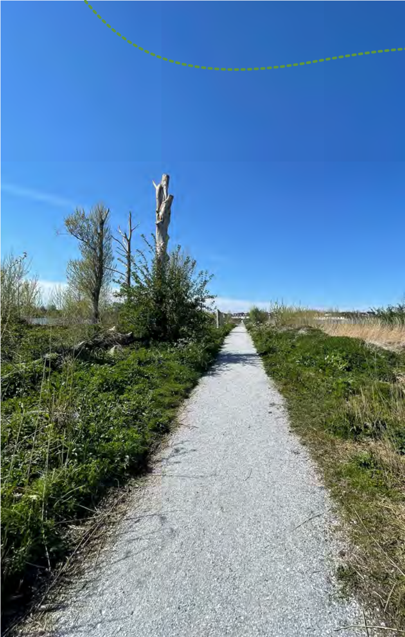
Het natuureiland tussen de vlonders op de Ouderkerkerplas