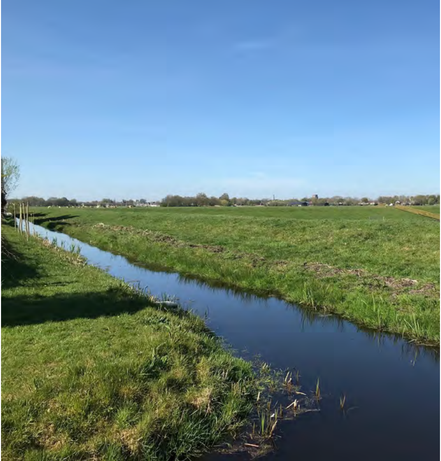
Kade De Toekomst: hoogteverschillen in het landschap door veenafgraving in vroegere tijden

H Het pad dat je nu volgt loopt hier over een voormalige vuilnisbelt van de gemeente Ouder-Amstel. Bij de herinrichting van het noordelijk gedeelte aan de Korte Dwarsweg is deze vuilnisbelt blijven bestaan en is er een pad overheen gelegd.