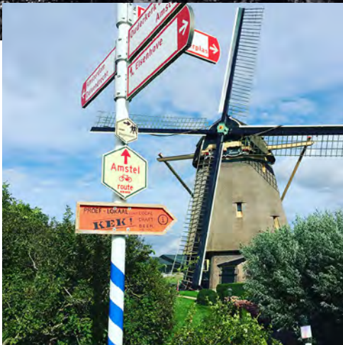
De achtkantige Molen De Zwaan stamt uit 1638