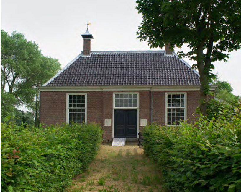
Joodse begraafplaats Beth Haim

de gedwongen bekering tot het christendom in hun thuisland. Nederland was hierbij een populaire bestemming, vanwege de relatieve vrijheid en tolerantie in die tijd. Veel Portugese Joden vestigden zich in Amsterdam, waar ze echter geen toestemming kregen voor de aanleg van een Joodse begraafplaats. In eerste instantie werden de doden daarom begraven in Groet, op een steenworp van Alkmaar.