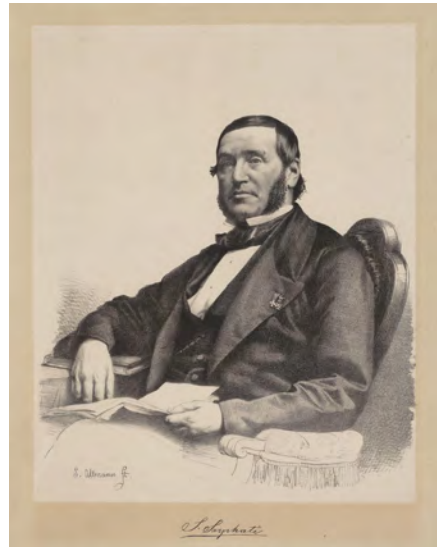
Samuel Sarphati - Beeld: Stadsarchief Amsterdam

Beth Haim ('Huis des Levens') staat bekend om zijn rijkelijk bewerkte marmere grafzerken en bijzondere gebouwen als het reinigingshuis