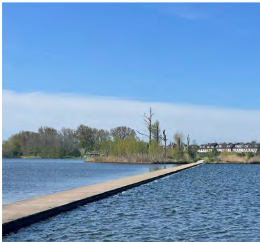
Loop hier via de lange vlonder over het water