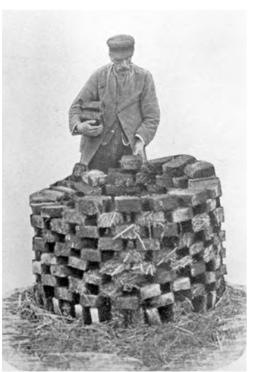
Turfsteker stapelt turfblokken om te drogen

In 1912 is hier een turfmakerij aangelegd, waarbij de afvoer van de turf via het kanaal Sluisvaart ging. In 1940 was de polder droog en zijn er onder meer sportvelden aangelegd. De aanleg van de A2 deelde deze polder begin jaren vijftig in tweeën. Het oostelijk deel werd in de zestiger