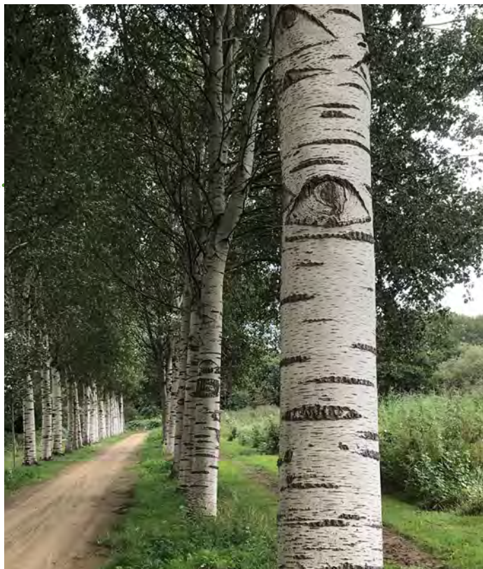
De grauwe abelen staren je aan in het Diemberbos

Punt 26 - 29 - 28 - 43 - 44 - 42 - 41 - 45