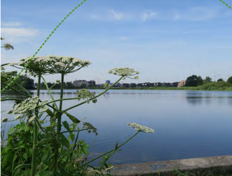
Mooi doorkijkje naar de Diem

waren zo klein of nat dat er alleen handmatig gemaaid en gehooid kon worden, waardoor er minder intensief beheerd werd. Door de natuur hier vooral zijn gang te laten gaan, ontstonden er bloemrijke stukjes langs de Diem.