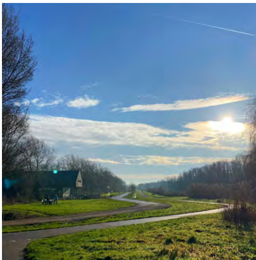
House of Bird

L Over mooie wandelpaden ben je al uitvoerig door en langs het Diemberbos geslalomd. Op dit punt zie je de Avatar bomen die op diverse plekken in het bos zijn aangeplant.