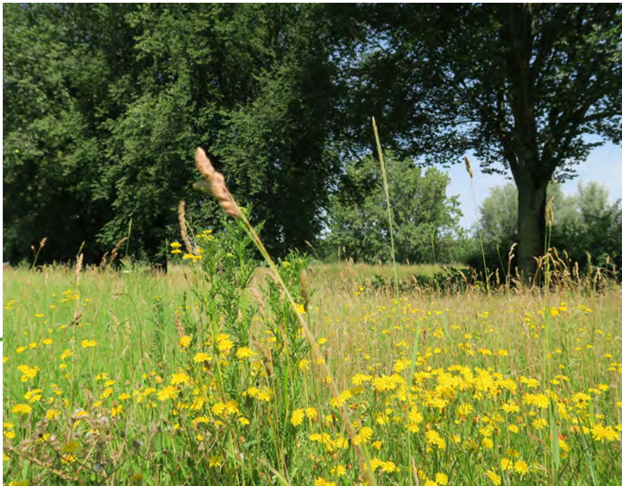
Het Penbos: een walhalla voor watervogels, rietvogels en bloeiende planten

moerasgebiedje aan de Diem is een populaire plek voor lepelaars, wilde zwanen, kuifeenden, aalscholvers en rietvogels. Het bos bestaat voornamelijk uit elzen en je kunt er onder meer dotterbloemen en echte koekoeksbloemen vinden.