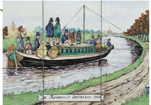
Een trekschuit omstreeks 1850

De trekvaart diende voor het vervoer van goederen, maar