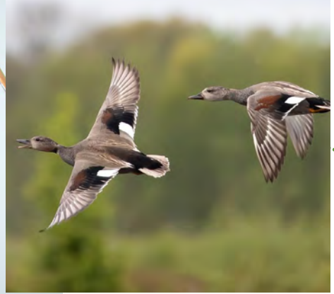
De krakeend, familie van de wilde eend, in vogelvlucht