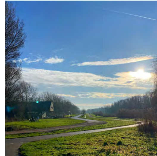
House of Bird

L Over mooie wandelpaden ben je al uitvoerig door en langs het Diemberbos geslalomd. Op dit punt zie je de Avatar bomen die op diverse plekken in het bos zijn aangeplant.