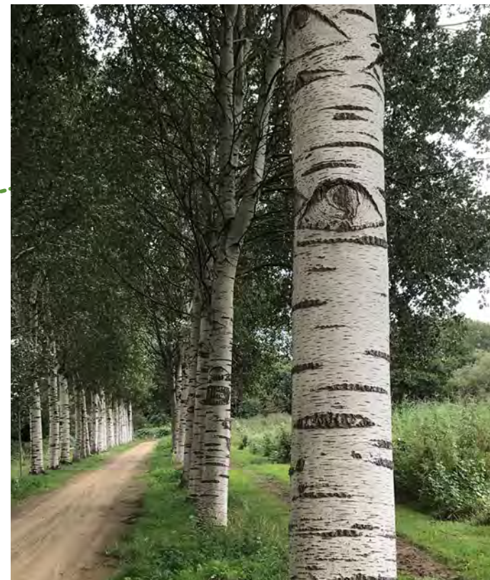
De grauwe abelen staren je aan in het Diemberbos

J Het Diemberbos is een betrekkelijk jong bos, in de jaren negentig aangelegd in de Gemeenschaps-polder. Deze polder is een 18e-eeuwse samenvoeging van een aantal kleine poldertjes, die halverwege de 19e eeuw door de aanleg van het Merwedekanaal (nu Amsterdam-Rijnkanaal) in tweeën is gesplitst.