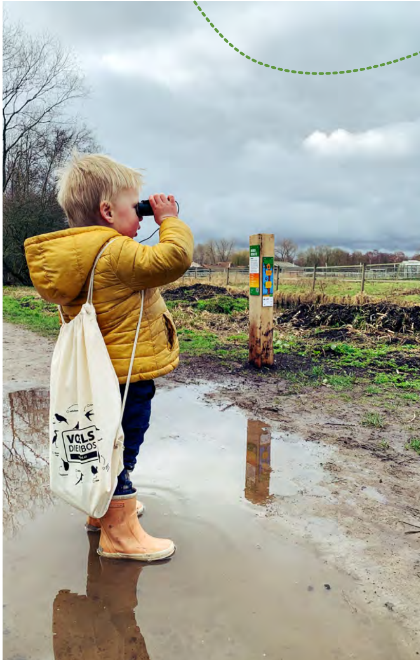
De Birdroute leert kinderen alles over de vogels in het Diemberbos