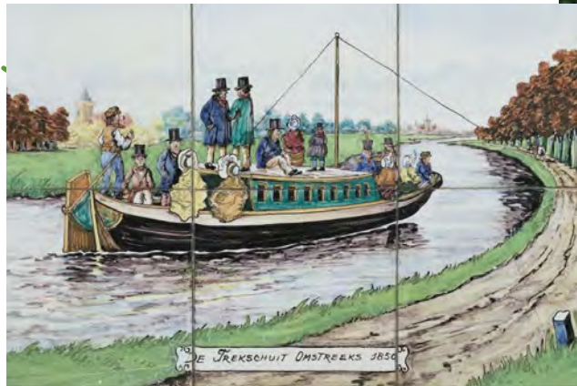
Een trekschuit omstreeks 1850 - Beeld: Tegel- en aardewerfabriek Westraven, Utrecht

De trekvaart diende voor het vervoer van goederen, maar