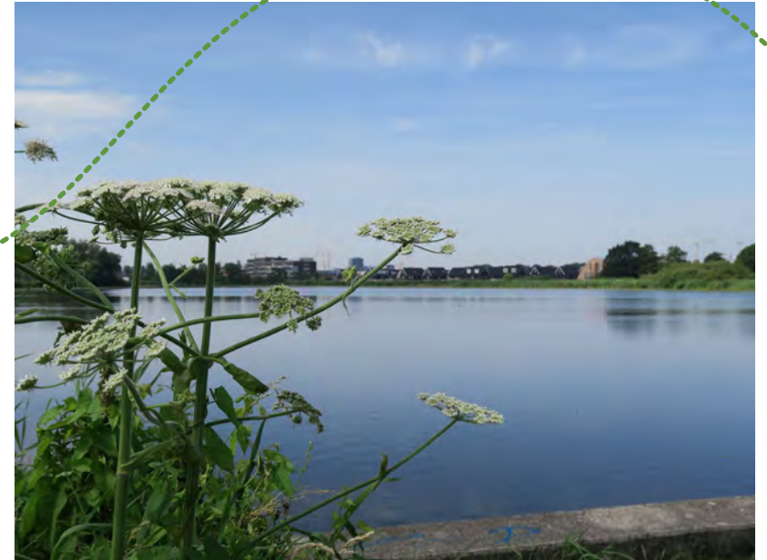
Mooi doorkijkje naar de Diem

F Langs de oevers van de Diem wandel je langs een aantal boerenerven met rietlandjes aan het water. Vroeger hadden de boeren die in de Overdiemerpolder boerde vaak een oeverlandje aan de Diem. De boeren beheerden deze oeverlandjes als hooiland. Deze percelen