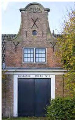
Poortgebouw met klokgevel (boven) en blustoren Buskruitmolen (rechts)