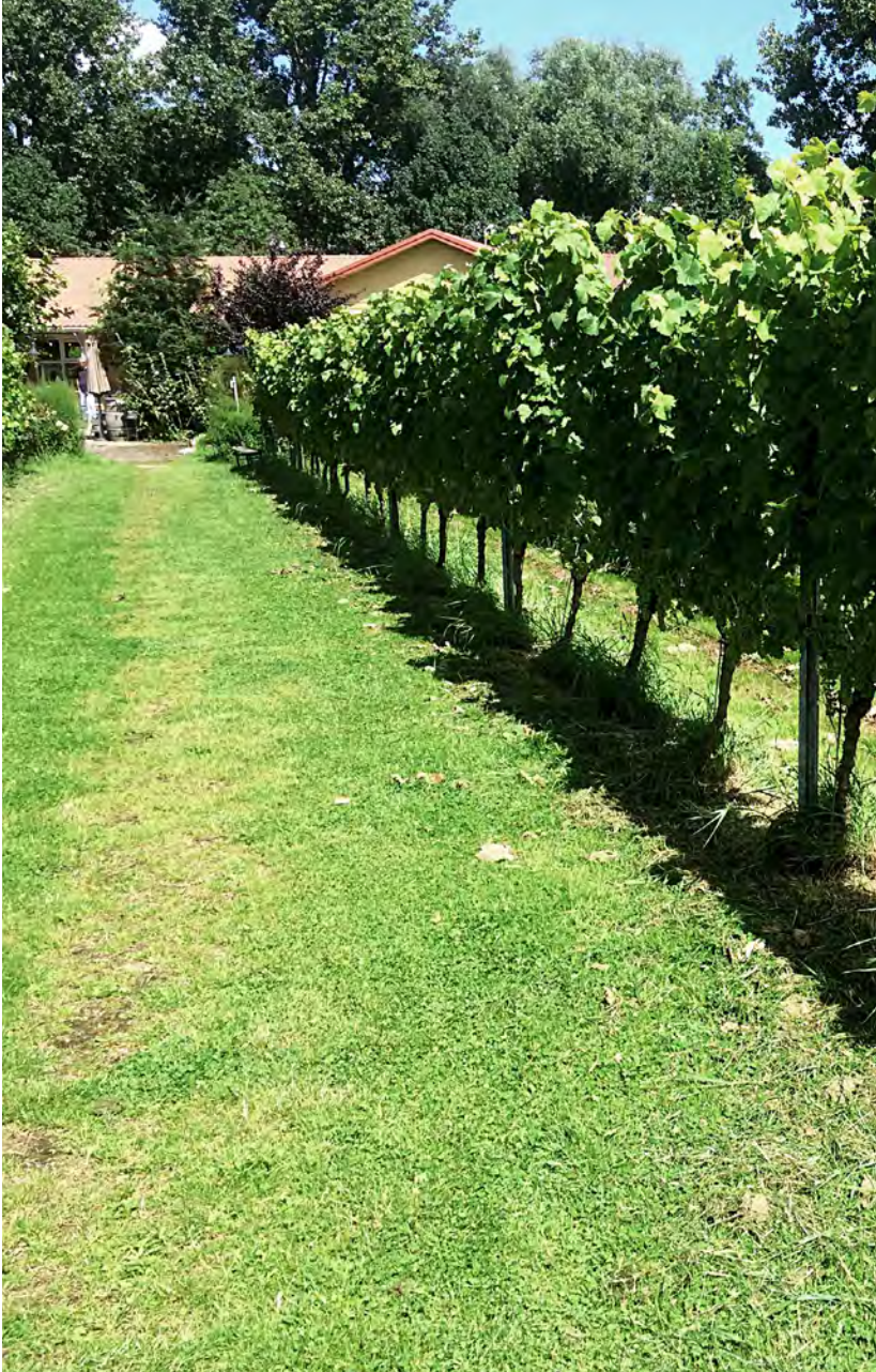
Wijngaard De Amsteltuin