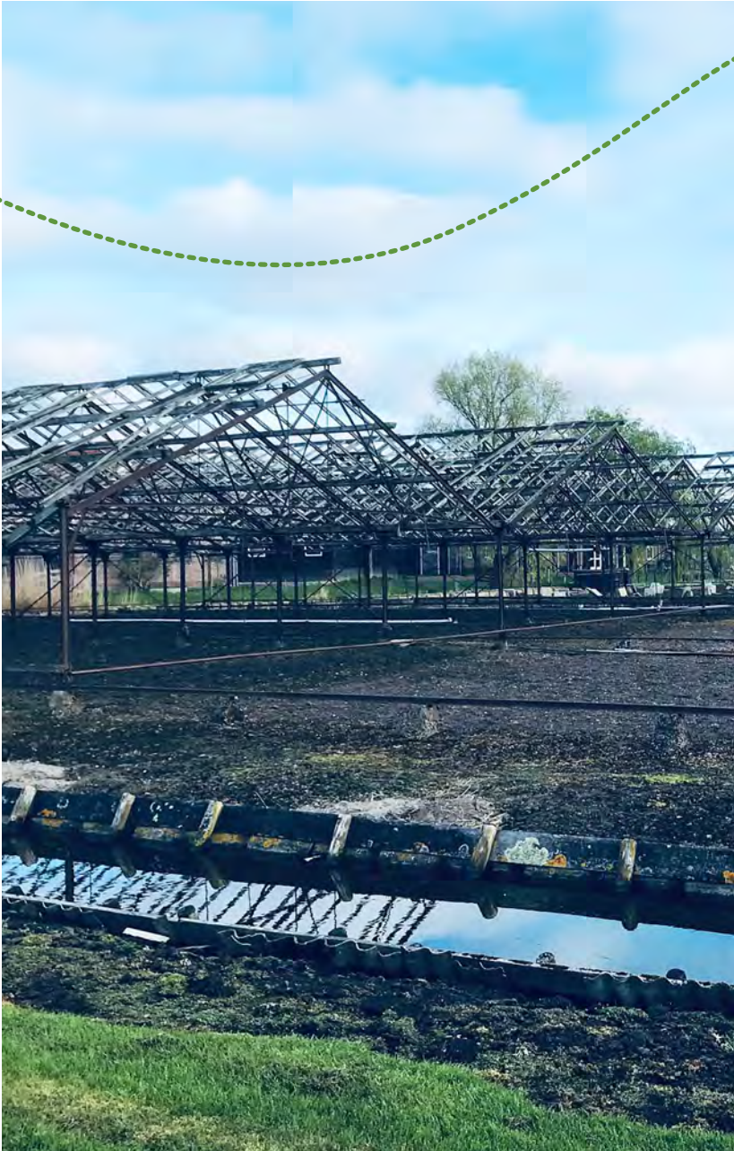
Deze kassen op wielen zijn via de rails verplaatsbaar