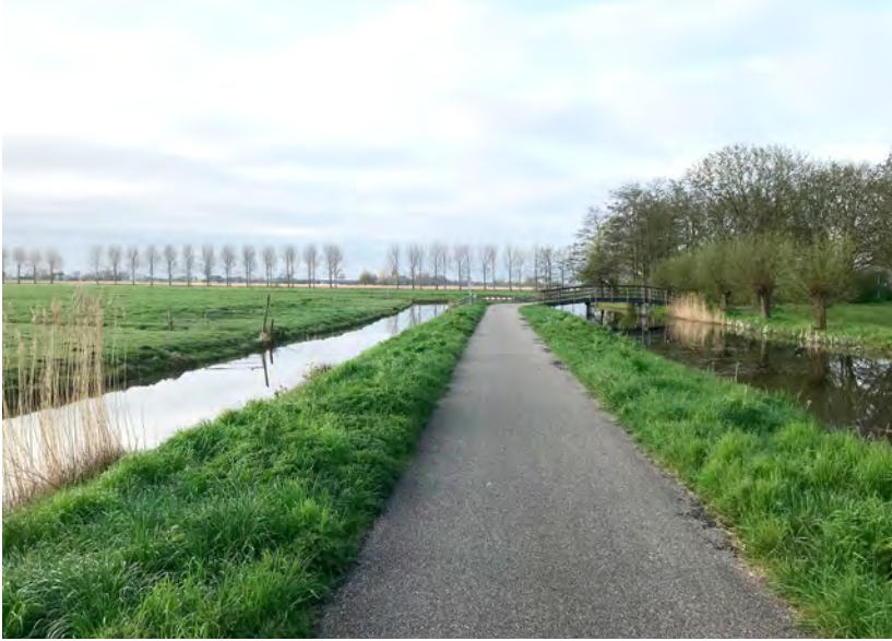
In de verte de Nesserlaan met aan weerszijde populieren

ontstane plassen werden later drooggemalen, waardoor de kenmerkende hoogteverschillen in dit gebied zijn ontstaan. Het droogmalen gebeurde met windmolens, vaak verschillende exemplaren achter elkaar, om het water hoog genoeg op te kunnen pompen. De resten van de zogenaamde molengangen zie je nog terug in de polder.