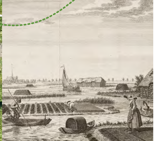
Turfsteken te Amstelveen