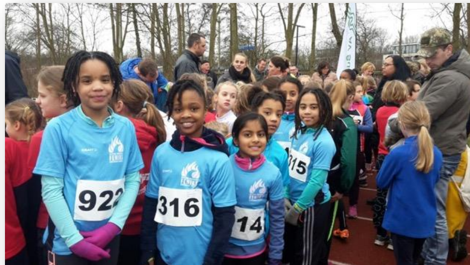
Figuur 2: De jongste deelnemers van de Gaasperplascross 2024

De kwantificering van de risico's leidt tot een gewenst weerstandsvermogen van € 562.500,-. De huidige weerstandscapaciteit ligt boven het niveau van de berekende risico's.