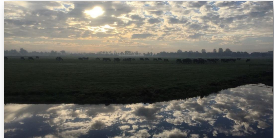
Figuur 6: Het wijds landschap van de Duivendrechtsepolder