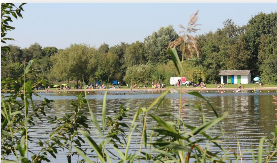
Figuur 5: Recreanten bij zwemstrand De Hoge Dijk