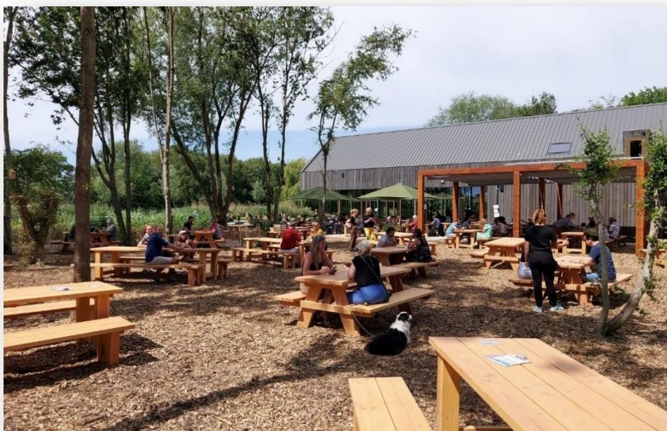
Figuur 3: House of Bird restaurant in het Diemerbos