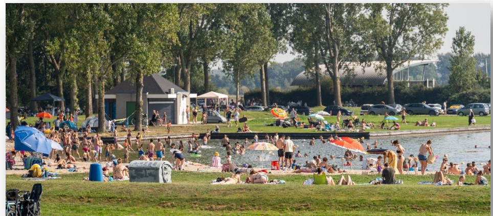
Figuur 2: Drukke bij Ouderkerkerplas

Om de recreatiedruk in financiële zin op te kunnen vangen, zijn de deelnemers aan het onderzoeken of de grondslag voor de berekening van de participantenbijdrage realistischer kan door deze te stoelen op bevolkingsgewicht. Onderzocht wordt of dit, gelijklopend met het zwaartepunt van de woningbouw, vanaf 2028 kan worden toegepast. Ondanks dat er op dit moment al sprake is van te weinig ruimte voor recreatie, wordt ook het tekort aan recreatieruimte alleen maar groter. Dit maakt het nog urgenter om met de ambities aan de slag te gaan in de vorm van een actiegericht ontwikkelprogramma. Naar verwachting beslist het bestuur van Groengebied Amstelland hierover in de tweede helft van 2025. Verwacht wordt dat de effecten zichtbaar zijn in de kadernota 2027 en de begrotingswijziging 2026.