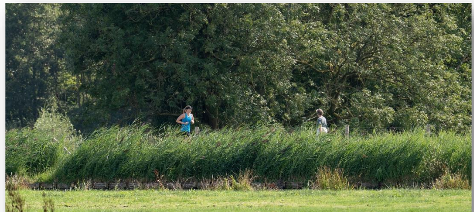
Figuur 4: Recreanten in de Middelpolder